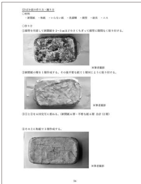
(お面作り・写真撮影は筆者)

船橋市の伝統的な祭りである「ばか面踊り」を素材とし、実際にお面を作成する手順等を用意した。伝統的な祭りを体験することで当時の人々の願いに触れ、地域のよさを理解することをねらいとした。