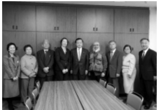
津田塾大学学長・佐倉市長・津田仙の子孫の方々と