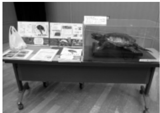
凶暴な外来種のカミツキガメは意外な大きさであった