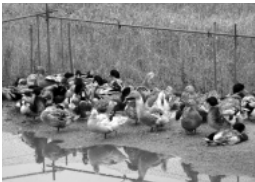
合鴨農法に使われた合鴨

筆者も印旛沼の水質が日本でワーストワンということは聞いていた。大学でその水を飲料水としていることも認識していた。