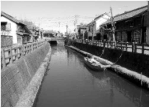
復興なった小野川沿いの家並