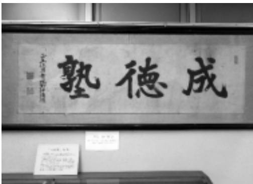
藩校「成徳塾」の扁額