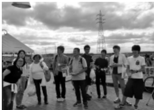
ふるさと広場にて